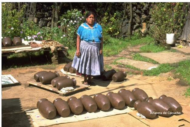
Alfarera de Cocucho