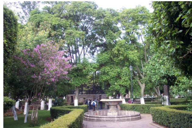
Plaza de Armas de Morelia