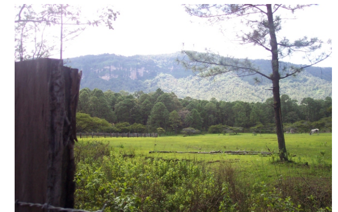
Bosque de Pino de Morelia