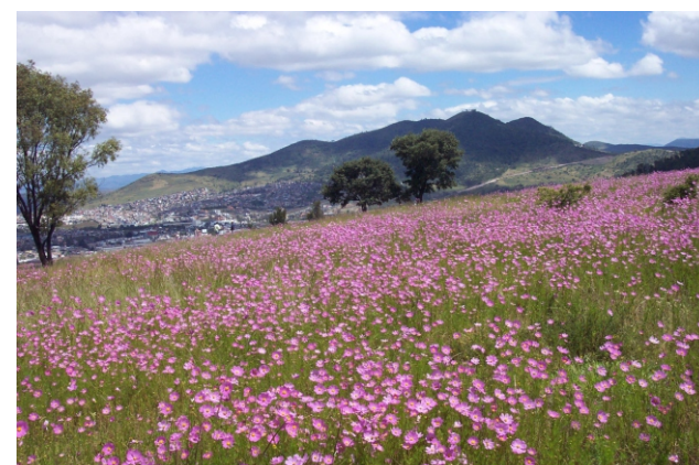
Campo con Mirasoles