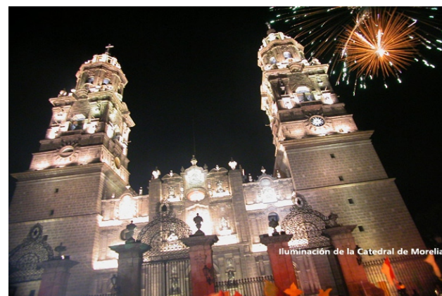
Catedral de Morelia

La Carta de la Tierra es el producto de conversaciones interculturales llevadas a cabo en el ámbito mundial durante una década, con respecto a metas comunes y valores compartidos.