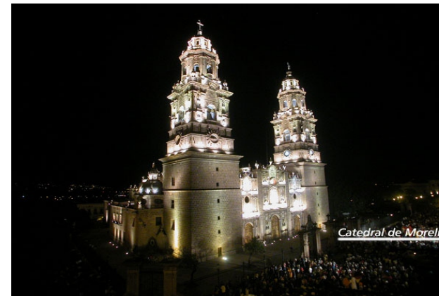
Iluminación Catedral de Morelia