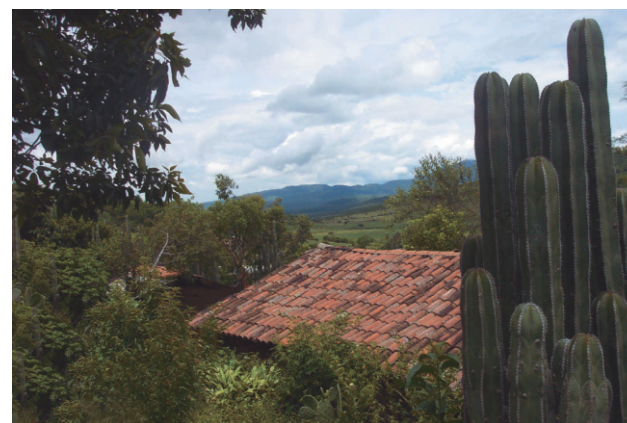
Comunidad de La Alberca