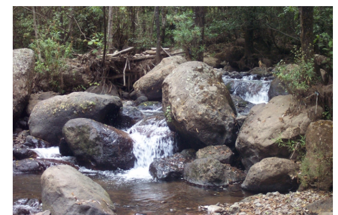
Carcada en Ichaqueo