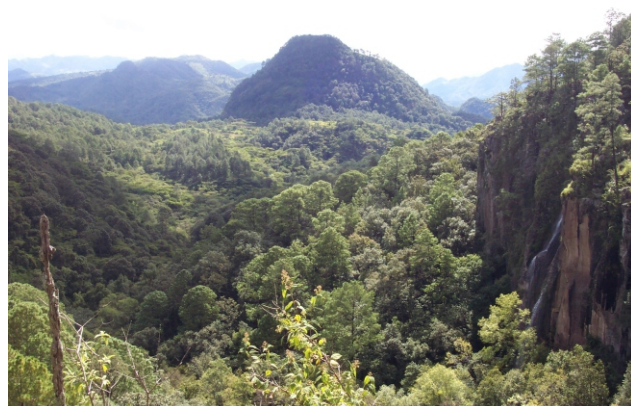
Bosque en Ichaqueo