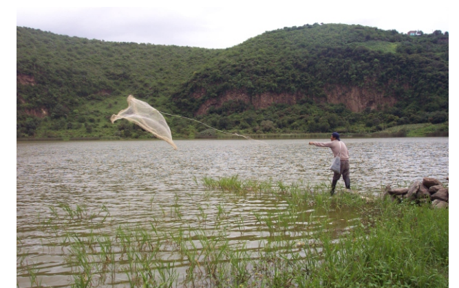
Pescador de La Alberca