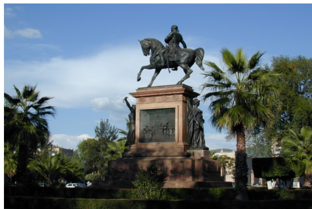
Monumento del Generalísimo José Ma. Morclos

Para llevar a cabo estas aspiraciones debemos tomar la decisión de vivir de acuerdo con un sentido de responsabilidad universal,