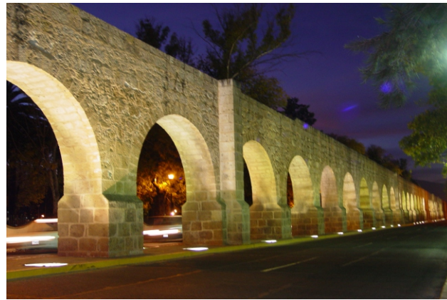
Acueducto de Morelia