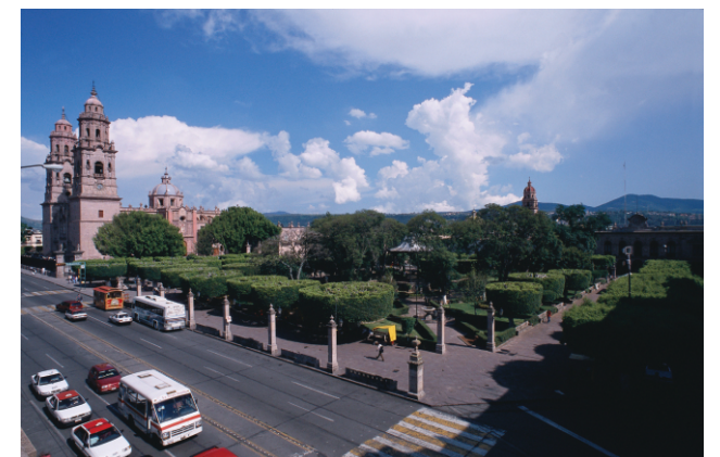
Centro histórico de Morelia