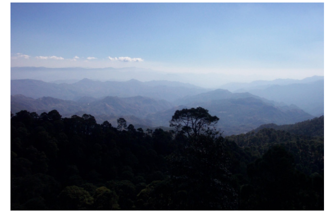
Atardecer en el sur de Morelia