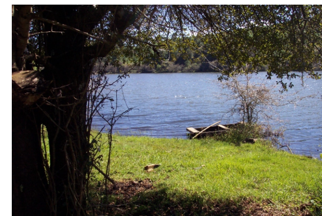
Presa de Umécuaro, Santiago Undameo

En 1997 se formó una Comisión de la Carta de la Tierra con el fin de supervisar el proyecto y la redacción de este documento. En ese mismo año, durante la conclusión del Foro de Río+5, celebrado también en Río de Janeiro, la Comisión