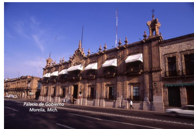
Palacio de Gobierno Morelia, Mich.