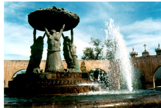
Fuente de las Tarascas