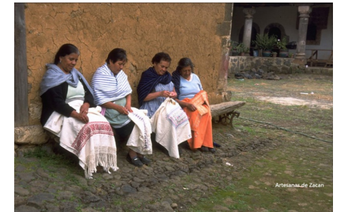
Artesanas de Zacán