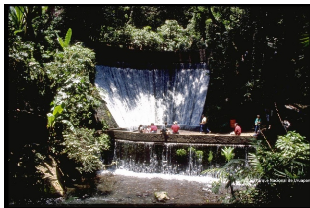
Parque Nacional de Uruapan