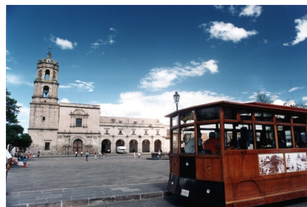
Iglesia y Convento de San Francisco

La Carta de la Tierra nos reta a examinar nuestros valores y a escoger un mejor camino. Nos hace un llamado a buscar un terreno común dentro de nuestra diversidad y a elegir una nueva visión ética compartida.