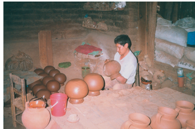
Artesano de Capula